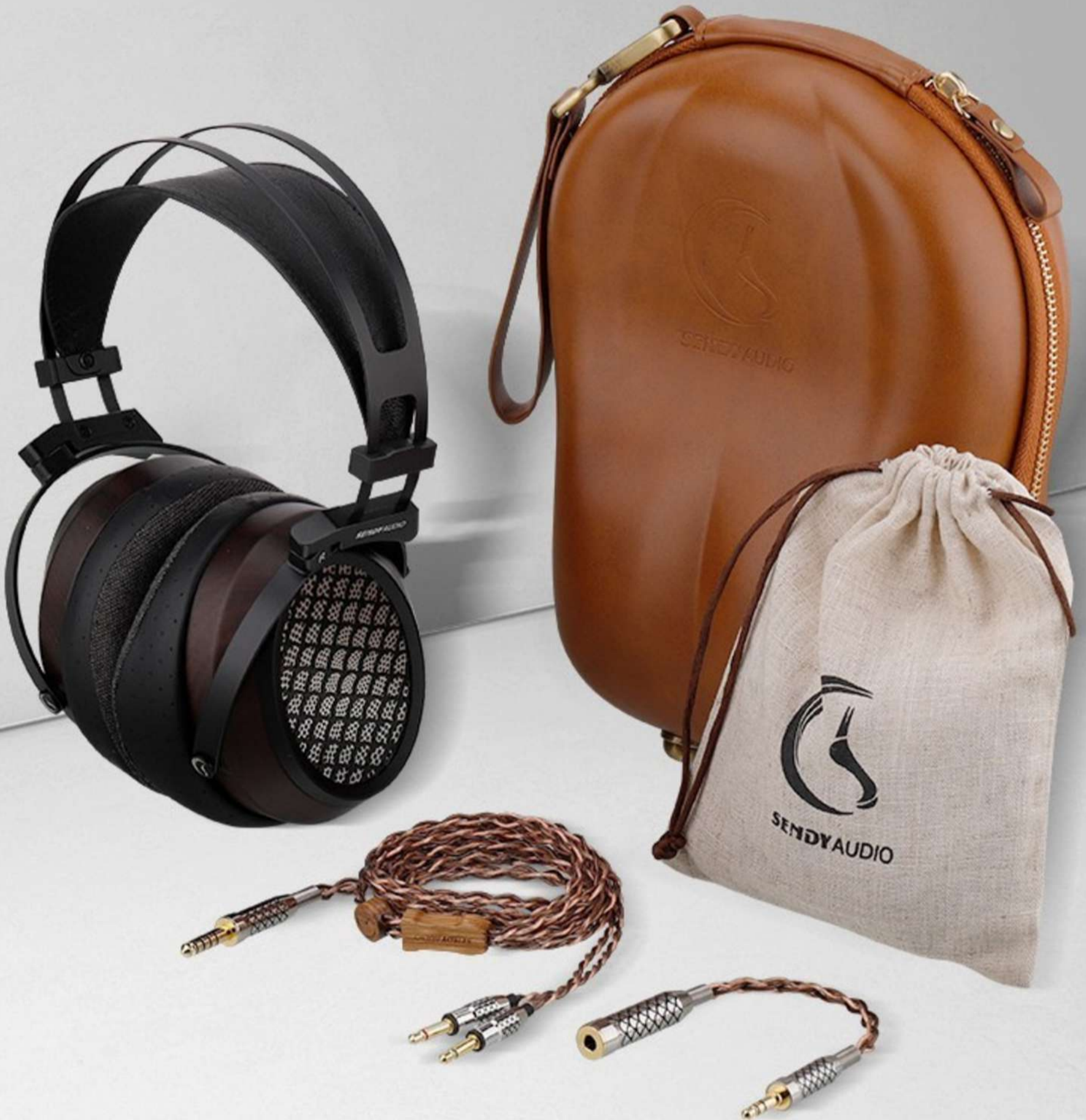
Casque Sendy Aiva 2