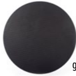
grille noire (option)